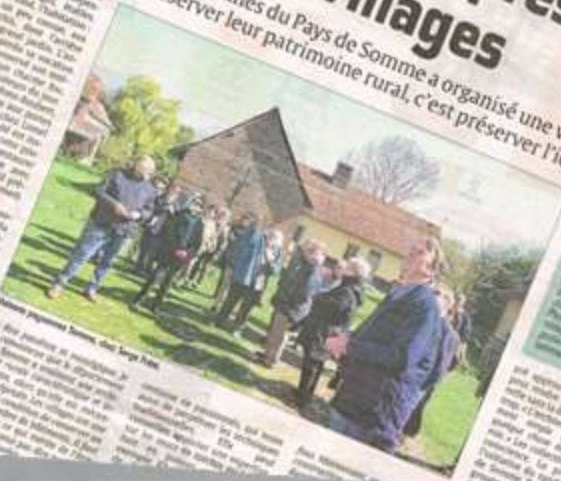
Une visite en perspective

L'association Maisons paysannes du Pays de Somme a organisé une visite de Mons-Boubert. Car préserver leur patrimoine rural, c'est préserver l'identité des villages.